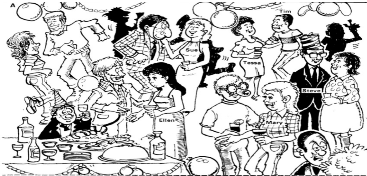
(Hadfield, J., Elementary Communication Games , 1984)